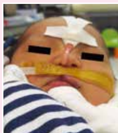
初生期開始在協會指導下進行三個月「非手術性唇鼻矯形」