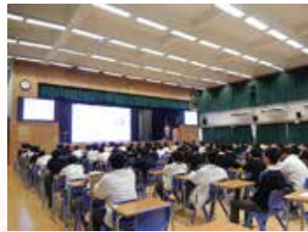
2024.1.2 生命教育 - 聖芳濟書院