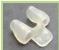
標準型鼻托 及配戴方法

「標準型鼻托」—適合3個月以上已接受補唇手術的患兒配戴，「標準型鼻托」原身設有一塊小板，小板上有兩個圓孔以供穿上橡筋配戴如圖示，好處為：(1)無需用巨形膠布貼面固定鼻托，避免引起皮膚敏感；(2)方便配戴；及(3)不易遺失。