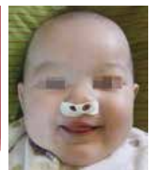
長管鼻托需貼上 打孔膠布固定在面上