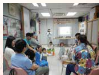
2024.3.23 第 100 - 103 期新生組重聚日