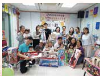
2024.3.23 第 100 - 103 期新生組重聚日