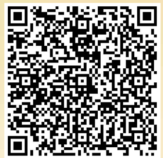
網上簽名運動二維碼