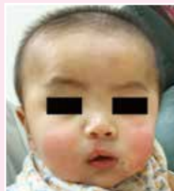
BB在屯門醫院接受補唇手術後唇鼻對稱和漂亮