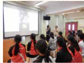
2024.3.8 生命教育 - 伊利沙伯舊生會中學