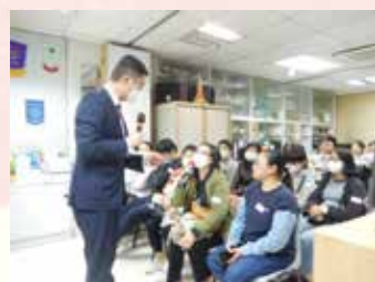
2024.3.2 強積金當家作主慈善講座