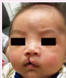
補唇手術前，唇部裂隙和鼻翼弧度已經有很大改善